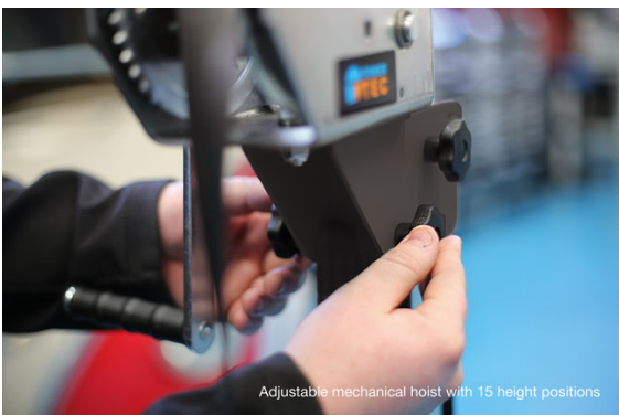
Adjustable mechanical hoist with 15 height positions